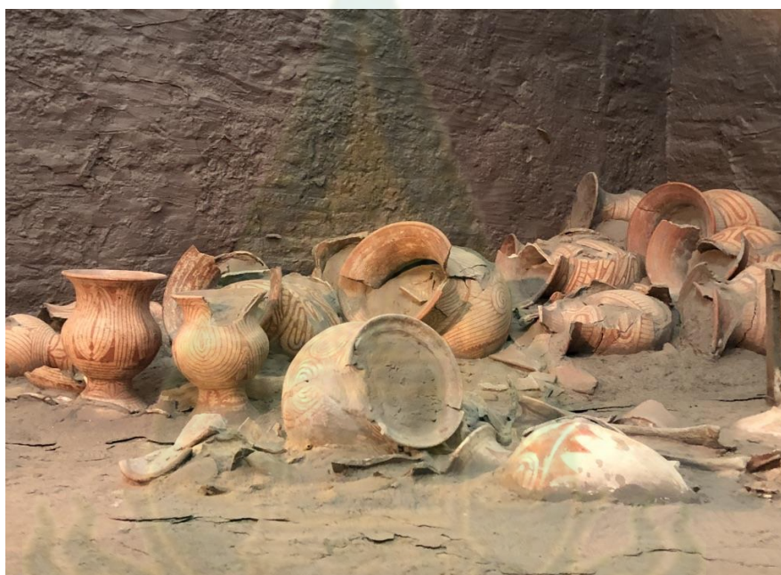
ภาพ 2.8 เครื่องปั้นดินเผาในสมัยก่อนประวัติศาสตร์

อุดรธานีเป็นจังหวัดที่มีอารยธรรมความเจริญในระดับสูงจังหวัดหนึ่งมาตั้งแต่สมัยโบราณ ด้วยการพบหลักฐานทางประวัติศาสตร์และ โบราณคดีที่บ่งบอกการดำรงอยู่ของมนุษย์ในบริเวณนี้ โดยพบว่าอุดรธานีโดยเฉพาะในบริเวณบ้านเชียงเคยเป็นถิ่นที่อยู่ของมนุษย์มาตั้งแต่สมัยก่อนประวัติศาสตร์ประมาณ 5,000-7,000 ปี ด้วยการพบเครื่องปั้นดินเผาสีลายเส้นที่บ้านเชียงนั้น สันนิษฐานว่าอาจเป็นเครื่องปั้นดินเผาสีลายเส้นที่เก่าที่สุดของโลก มีการพบเครื่องมือเครื่องใช้จากสำริด เช่น ใบหอก หัวขวาน มีดและหัวลูกศร ฯลฯ เครื่องมือเหล็ก เครื่องประดับสำริด เช่น กำไล ข้อมือ กำไลข้อเท้า สร้อยคอ ฯลฯ (ปิ่นฉัตร หมอชาติ, 2560, น. 2-12)