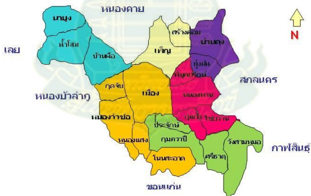
ภาพ 2.7 แผนที่จังหวัดอุดรธานี

ทิศตะวันตก ติดกับ จังหวัดเลยและจังหวัดหนองบัวลำภู