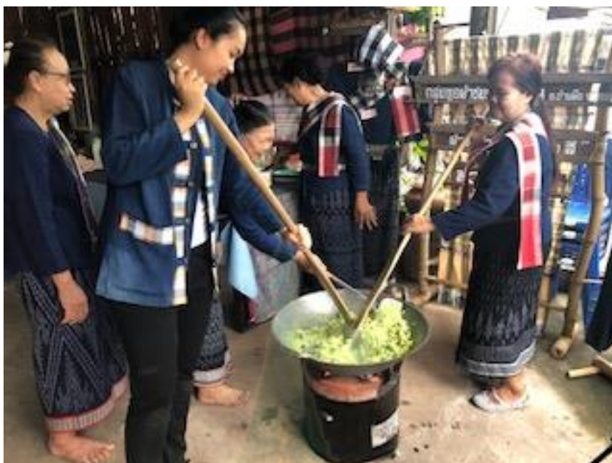
ภาพ 2.5 ประเพณีการกวนข้าวงาโค