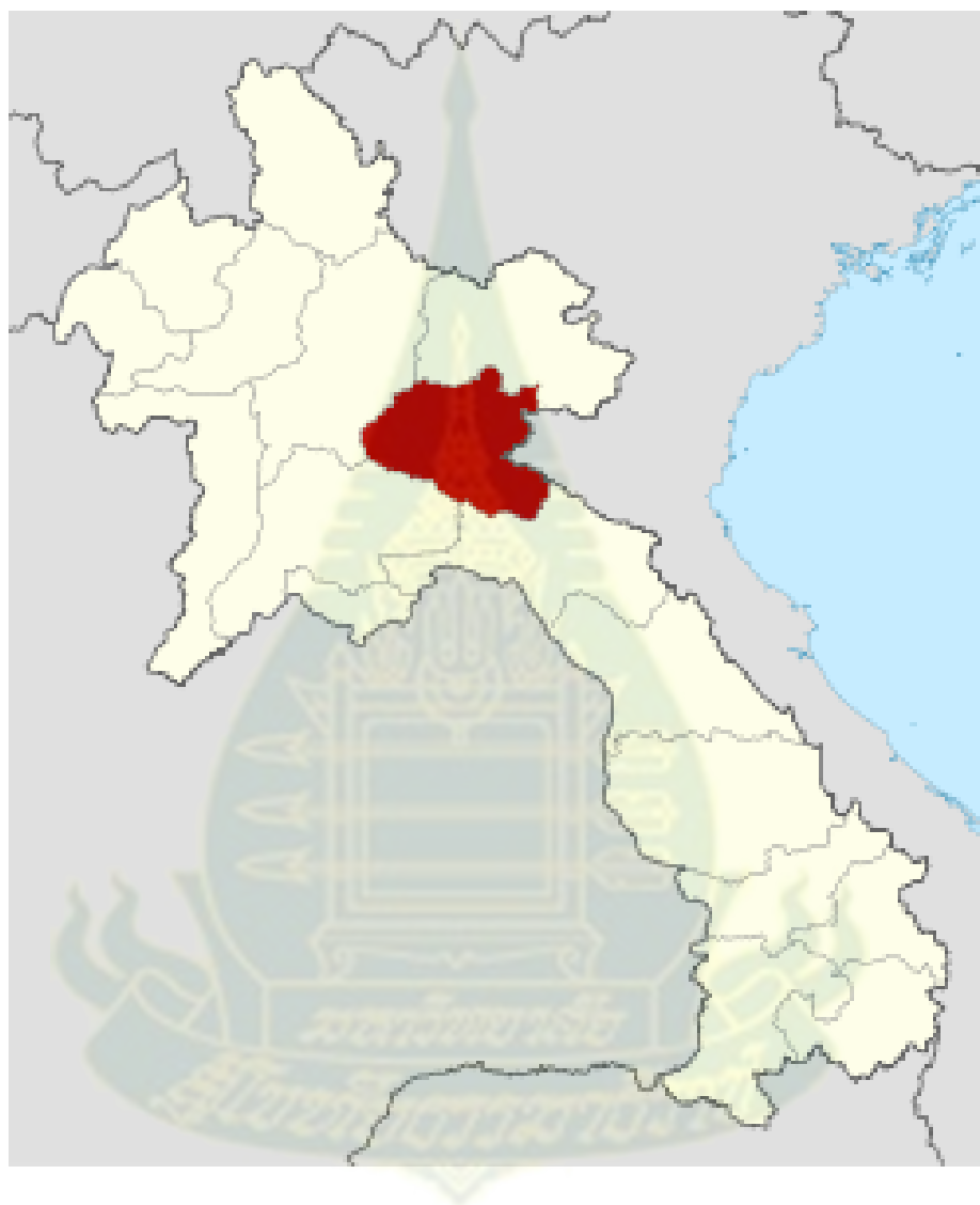
ภาพ 2.1 ที่ตั้งเมืองเชียงขวาง ประเทศสาธารณรัฐประชาธิปไตยประชาชนลาว ที่มา: https://th.wikipedia.org/wiki/แขวงเชียงขวาง สืบค้นเมื่อ 8 มกราคม 2561.

“ภูเอิน” หรือ “ภูเอิ้น” (วิเชียร วงศ์วิเศษ, 2517, น. ๖) การสันนิษฐานตรงกับการศึกษาเอกสารงานวิจัยของ ปิยะพร วามะสิงห์ (ปิยะพร วามะสิงห์, 2538, น. 8) ส่วนในประเทศไทย คำว่า “พวน” เป็นชื่อของคนไทยสาขาหนึ่ง ซึ่งทางภาคอีสาน เรียกว่า “ไทยพวน” แต่ทางภาคกลางเรียกว่า “ลาวพวน” 1