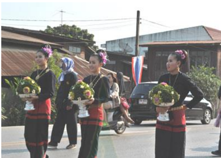
ภาพ 2.4 ขบวนแห่ในพิธีกำฟ้า