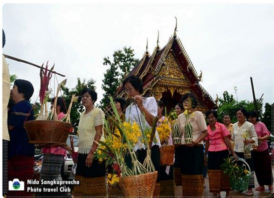
ภาพ 2.6 ประเพณีใส่กระจาด