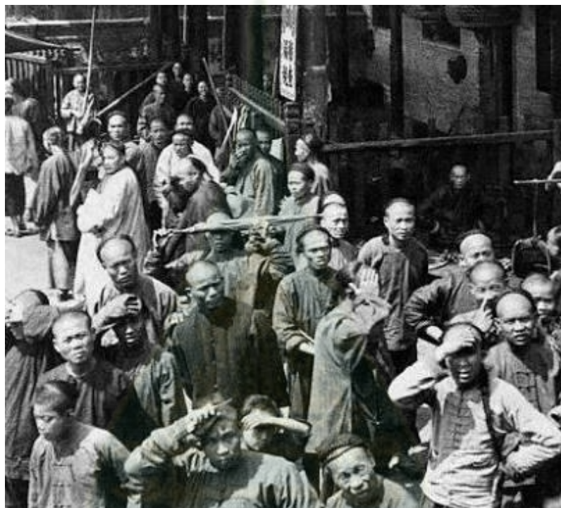
ภาพ 2.9 พวกฮ่อหรือกองกำลังชาวจีน

ในเวลานั้นเมืองอุรธานียังไม่ปรากฏชื่อ เพียงแต่ปรากฏชื่อ “บ้านหมากแข้ง” หรือ “บ้านเตื่อหมากแข้ง” สังกัดเมืองหนองคาย และขึ้นการปกครองกับมณฑลลาวพวน และกรมหมื่นประจักษ์ศิลปาคมแม่ทัพใหญ่ฝ่ายใต้ได้เดินทัพผ่านบ้านหมากแข้งไปทำการปราบปรามพวกฮ่อจนสงบ (ฉัฐพร ตริสุริยาแสงโชต, 2559, น. 5) สามารถปราบฮ่อได้ราบคาบแล้วจึงยกกำลังกลับถึงกรุงเทพฯ เมื่อวันที่ 7 มิถุนายน พ.ศ. 2430