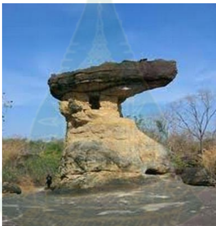
ภาพ 2.11 ภูพระบาท หรือภูภูเขาแต้ สถานที่สำคัญของบ้านฝื่อ

พื้นที่ของอำเภอบ้านฝื่อมีเทือกเขาภูพานที่มีลักษณะเป็นเทือกเขาหินทราย สันนิษฐานว่าเกิดในยุคที่โลกถูกปกคลุมด้วยน้ำแข็ง (Mesozoic - Cretaceous) ต่อมาเมื่อธารน้ำแข็งละลายและเคลื่อนตัวลงตามแรงดึงดูดของโลกเมื่อประมาณ 180 ล้านปีมาแล้ว นำไปสู่การกัดกร่อนของเทือกเขาภูพาน ทำให้เกิดเป็นเพิงหินรูปร่างแปลกๆ งดงาม เช่น ภูพระบาท หรือภูภูเขาแต้เดิม ภูพระบาทเป็นแหล่งต้นน้ำลำธารหลายสาย เช่น ห้วยหินลาด ห้วยด่านใหญ่ ห้วยหินร่อง และห้วยนางอุสา ซึ่งไหลลงไปแม่น้ำโขงที่อำเภอบ้านฝื่อ ภูพระบาทมีความสูงจากระดับน้ำทะเลปานกลาง 320 - 350 เมตร ( http://district.cdd.go.th/banphu/about-us/ประวัติความเป็นมา-2/ สืบค้นเมื่อ 17 กุมภาพันธ์ 2561)