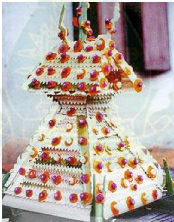
ภาพ 2.3 ปราสาทผึ้งของไทยพวน

ความเชื่อเกี่ยวกับบุญปราสาทผึ้ง ส่วนหนึ่งมาจากความเชื่อที่ว่า พระพุทธเจ้าเมื่อเสด็จลงมาจากสวรรค์ พระองค์ได้ทรงแสดงปาฏิหาริย์ด้วยการเปิดโลกทั้งสาม คือ สวรรค์ มนุษย์ และนรก ให้เห็นถึงกันได้ ส่งผลให้มนุษย์ได้มองเห็นวิมานบนสวรรค์และเกิดความต้องการที่จะได้ขึ้นไปอยู่ในสถานที่อันงดงามเช่นนั้นบ้าง ขณะเดียวกันก็ได้ทราบว่าการจะได้ขึ้นไปในวิมานได้นั้นจะต้องสร้างบุญสร้างกุศล รักษาศีล ปฏิบัติธรรม โดยการทำบุญอย่างหนึ่ง คือ การสร้างปราสาทกองบุญในขณะที่ยังมีชีวิตอยู่ จึงเป็นที่มาของการสร้างบุญด้วยการสร้างปราสาทผึ้ง ( https://mgronline.com/travel/detail/9480000142416 สืบค้นเมื่อ 11 มกราคม 2561)