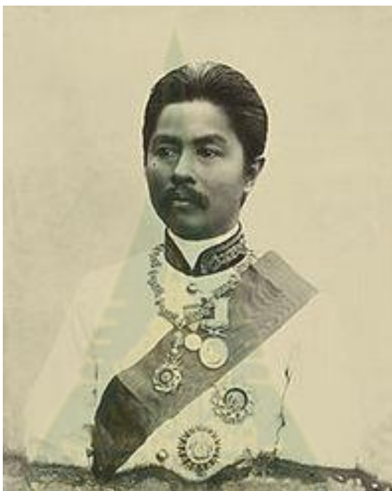
ภาพ 2.10 พระเจ้าบรมวงศ์เธอ กรมหมื่นประจักษ์ศิลปาคม

แห่งนี้มีชัยภูมิเหมาะสม เพราะมีแหล่งน้ำดี เช่น หนองนาเกลือ (หนองประจักษ์ปัจจุบัน) และหนองน้ำอีกหลายแห่งรวมทั้งห้วยหมากแข้งซึ่งเป็นลำห้วยน้ำใส กรมหมื่นประจักษ์ศิลปาคมจึงทรงบัญชาให้ตั้งศูนย์กลางมณฑลลาวพวน และตั้งกองทหารขึ้น ณ หมู่บ้านเคื่อหมากแข้ง ( https://th.wikipedia.org/wiki/จังหวัดอุดรธานี สืบค้นเมื่อ 1 พฤศจิกายน 2561)